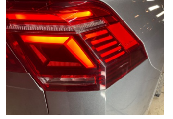
Farlar, Far camı, sağ > Yüzeysel Çizik