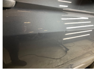
Kapı, sağ ön, Kapı, sağ > Noktasal Ezik