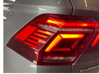
Farlar, Far camı, sol > Çizik