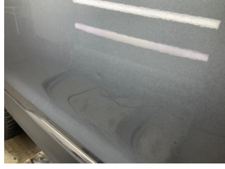
Kapı, sol ön, Kapı, sol > Noktasal Ezik