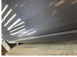
Kapı, sağ ön, Kapı, sağ ön > Noktasal Ezik