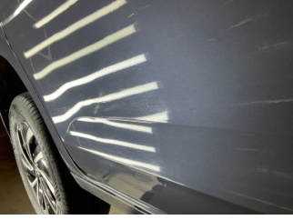
Kapı, sağ arka, Kapı kolu, iç > Standart Dışı Onarım