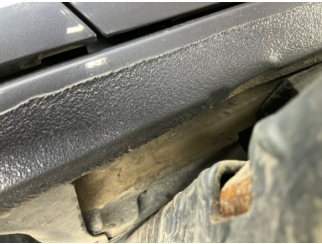
Marşbiyel, sol, Marşbiyel, sol > Vuruk