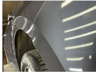
Tampon, arka, Arka tampon > Ezic