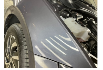
Çamurluk, sağ, Çamurluk, sağ > Standart Dışı Onarım