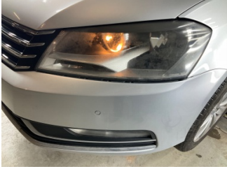
Tampon, ön, Ön tampon > Sabitlemesi Hatalı