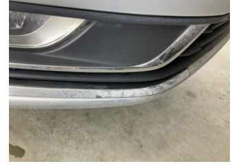
Tampon, ön, Ön tampon ızgarası > Kırılmış