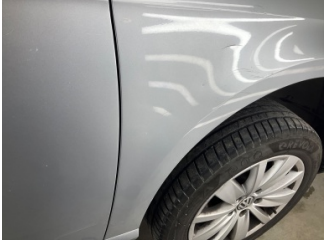
Çamurluk, sağ, Çamurluk, sağ > Çizik