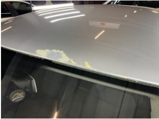
Tavan, Tavan > Boyası Atmış