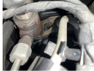
Motor, Enjektör kablo demeti > Sızdırıyor