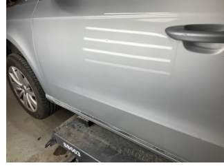
Kapı, sol ön, Kapı, sol ön > Vuruk