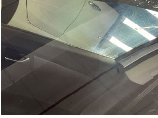
Camlar, Ön cam > Çatlak

Sayfa: 11/13 Araç Çıkış Tarihi: 20.04.2026 15:50