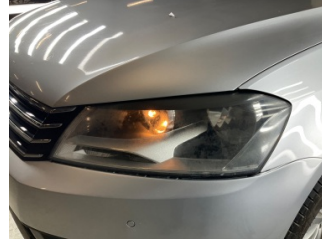
Farlar, Far camı, sol > Deforme Olmuş