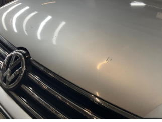
Motor kaputu, Motor kaputu > Ezik