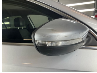
Dikiz aynası, sağ, Dış dikiz aynası kapağı > Çizik