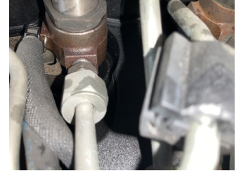
Motor, Enjektör kablo demeti > Sızdırıyor