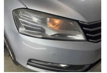
Farlar, Far camı, sağ > Deforme Olmuş