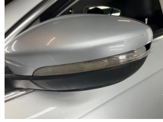
Dikiz aynası, sol, Sinyal lambası > Hasarlı