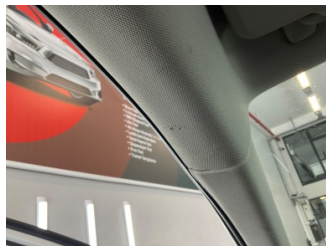
Döşemeler/Kapaklar, Döşemeler/Kapaklar > Yakıcı Madde ile Zarar Görmüş