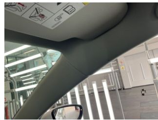
Döşemeler/Kapaklar, Döşemeler/Kapaklar > Yakıcı Madde ile Zarar Görmüş