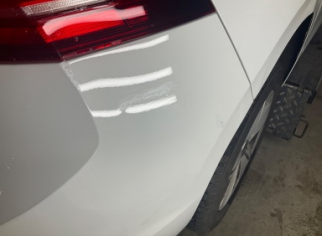
Tampon, arka, Arka tampon > Rötüş