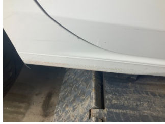
Marşbiyel, sağ, Marşbiyel, sağ > Çizik