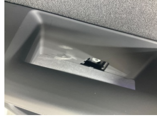
Kapı, sağ arka, Nikelaj, orta > Sökülmüş-Yok