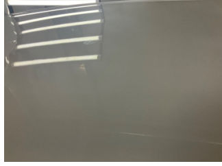
Tavan, Tavan > Yakıcı Madde ile Zarar Görmüş