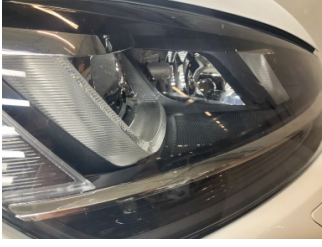
Farlar, Far camı, sağ > Taş Izi