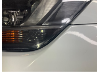
Farlar, Far camı, sol > Çatlak