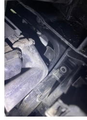
Kaporta, Ön Panel > Kırılmış