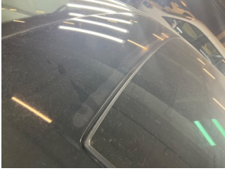
Tavan, Sunroof çerçeve/kasa > Deforme Olmuş