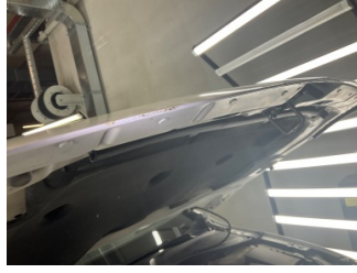
Motor kaputu, Motor kaputu > Boyası Atmış