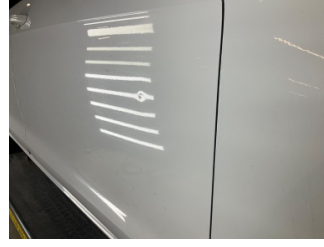
Kapı, sağ ön, Kapı, sağ ön > Küçük Vuruk