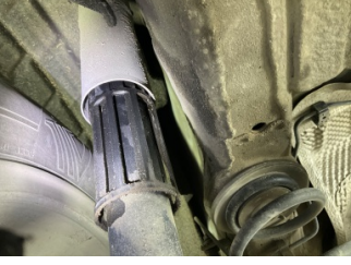
Arka aks, Amortisör, arka sol > Yağ Kaçağı

Sayfa: 9/10 Araç Çıkış Tarihi: 27.03.2026 09:13