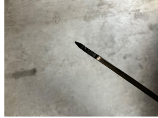
Motor, Yağ seviyesi > Eksik