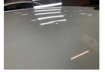
Tavan, Tavan > Noktasal Ezik