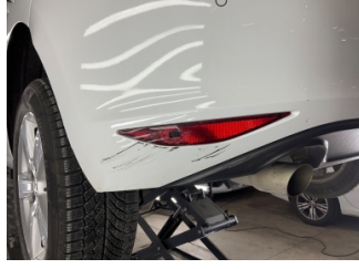
Tampon, arka, Reflektör, sol > Hasarlı