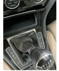
Pano/Göstergeler, Pano, orta > Deforme Olmuş