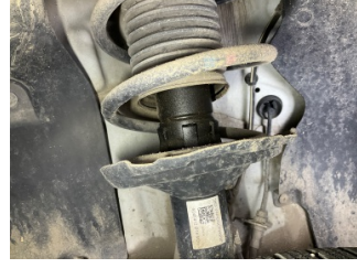
Ön aks, Amortisör, ön sol > Yağ Kaçağı