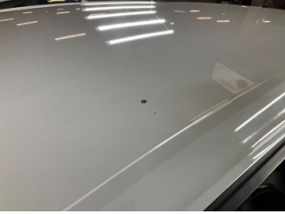
Tavan, Tavan > Boyası Atmış