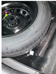
Arka bölüm, Bagaj havuzu > Onaysız