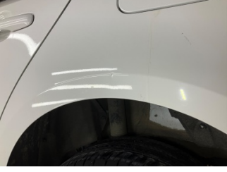
Çamurluk, sol arka, Çamurluk, sol arka > Noktasal Ezik