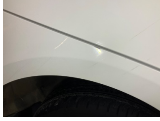
Çamurluk, sağ arka, Çamurluk, sağ arka > Boyası Atmış