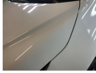
Motor kaputu, Motor kaputu > Taş izi