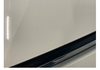
Motor kaputu, Motor kaputu > Taş izi