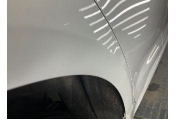
Çamurluk, sağ arka, Çamurluk, sağ arka > Noktasal Ezik