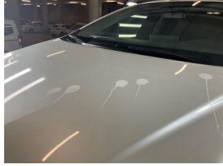
Motor kaputu, Motor kaputu > Yakıcı Madde ile Zarar Görmüş