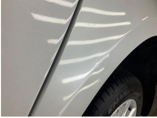
Çamurluk, sol, Çamurluk, sol > Noktasal Ezik