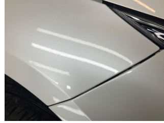
Tampon, ön, Ön tampon > Sabitlenmesi Hatalı