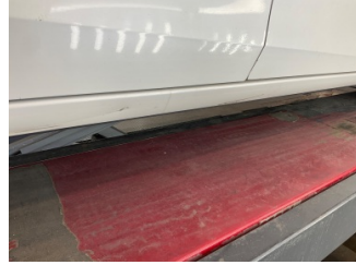
Marşbiyel, sağ, Marşbiyel, sağ > Çizik