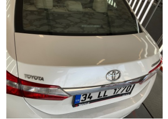
Kaporta, Kaporta > Standart Dışı Onarım