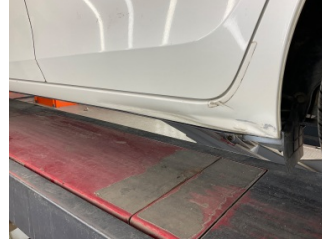
Marşbiyel, sol, Marşbiyel, sol > Hasarlı