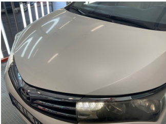
Kaporta, Kaporta > Standart Dışı Onarım