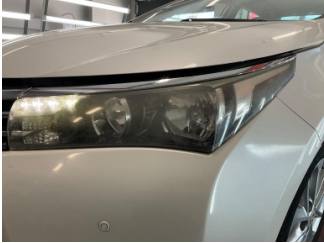
Farlar, Far camı, sol > Solmuş