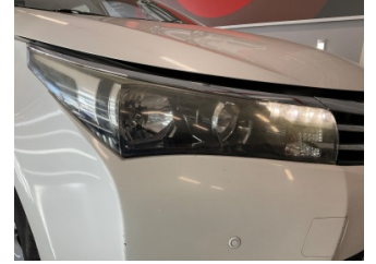
Farlar, Far camı, sağ > Solmuş