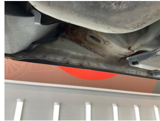
Kaporta, Kaporta > Pas