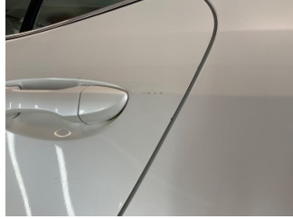
Kapı, sol arka, Kapı, sol arka > Pas