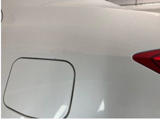
Çamurluk, sol arka, Çamurluk, sol arka > Pas