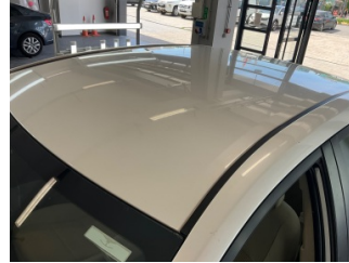
Kaporta, Kaporta > Standart Dışı Onarım