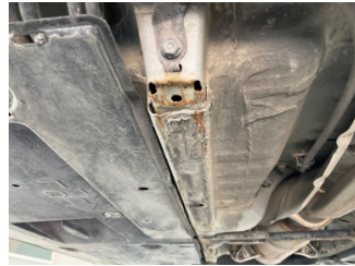
Kaporta, Kaporta > Pas