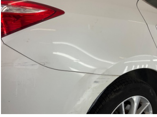
Çamurluk, sağ arka, Çamurluk, sağ arka > Deforme Olmuş

Sayfa: 8/9 Araç Çıkış Tarihi: 16.06.2026 10:46