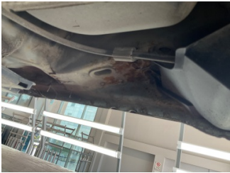
Kaporta, Kaporta > Pas