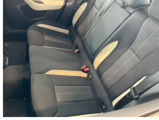
Koltuklar, arka, Arka koltuk döşemesi > Kirlenmiş