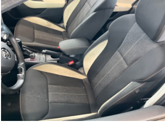
Koltuklar, ön, Koltuk döşemesi, sağ ön > Kirlenmiş