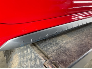
Marşbiyel, sağ, Marşbiyel plastiği, sağ > Hasarlı