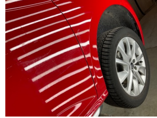
Çamurluk, sağ, Çamurluk, sağ > Çizik