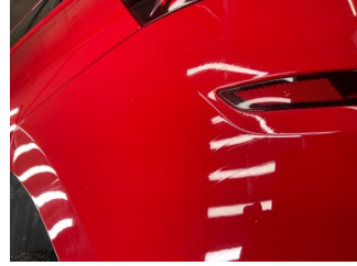
Tampon, arka, Arka tampon > Boyası Atmış