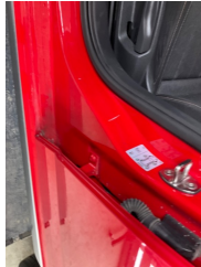
Kaporta, B-direk, sol > Çizik