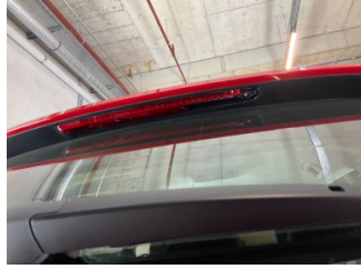
Arka lambalar, Üçüncü fren lambası > Hasarlı