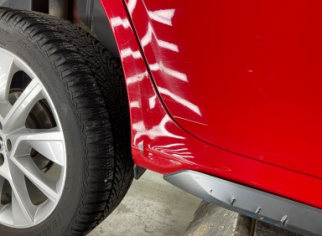
Marşbiyel, sağ, Marşbiyel, sağ > Ezik