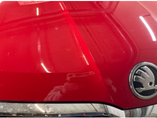
Motor, Motor > Taş Izi