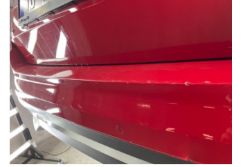
Tampon, arka, Arka tampon > Boyası Atmış