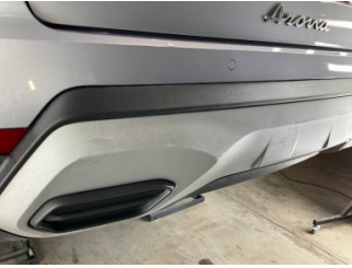
Tampon, arka, Spoiler > Çizik