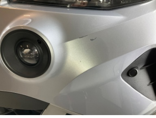
Tampon, ön, Ön tampon > Küçük Çizik