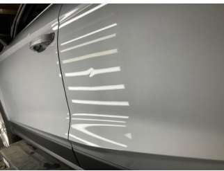
Kapı, sol ön, Kapı, sol ön > Vuruk