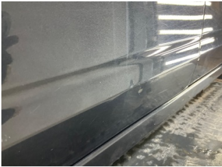
Kapı, sol ön, Kapı, sol > Ezic