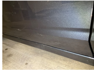
Kapı, sol ön, Kapı, sol ön > Vuruk