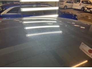
Tavan, Tavan > Yakıcı Madde İle Zarar Görmüş