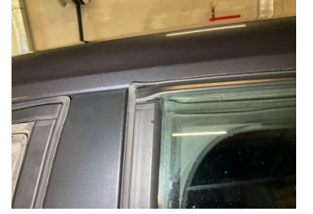
Kapı, sol arka, Cam sıyrıcı fitili, dış > Onaysız