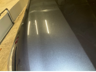
Motor kaputu, Motor kaputu > Yakıcı Madde İle Zarar Görmüş