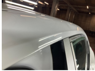
Kaporta, Sol Üst Frangart > Ezik