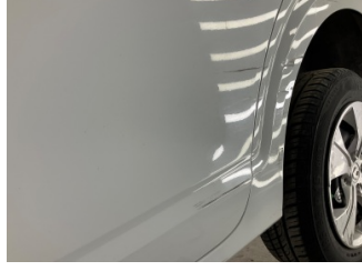
Kapı, sol arka, Kapı, sol arka > Yüzeysel Çizik