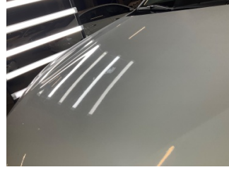
Motor kaputu, Motor kaputu > Yakıcı Madde Ile Zarar Görmüş