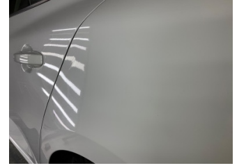
Çamurluk, sol arka, Çamurluk, sol arka > Küçük Vuruk