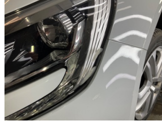
Farlar, Far camı, sol > Çizik