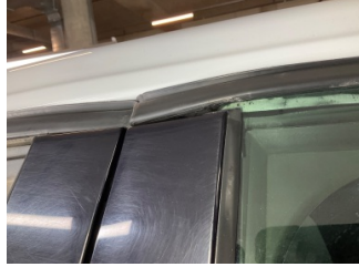
Kapı, sol arka, Kapı bandı > Kırılmış