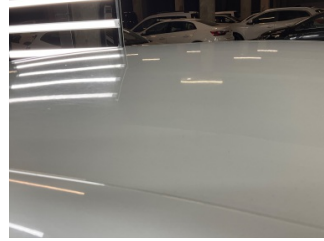
Tavan, Tavan > Noktasal Ezik