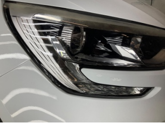
Farlar, Far camı, sağ > Çizik