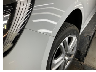
Çamurluk, sol, Çamurluk, sol > Rötüş