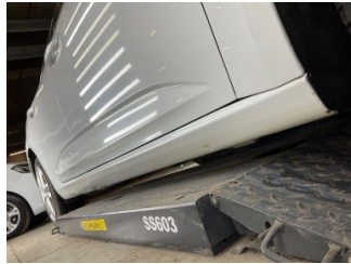
Marşbiyel, sağ, Marşbiyel, sağ > Ezik