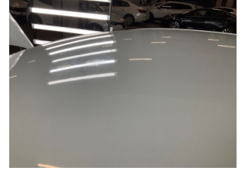
Tavan, Tavan > Yakıcı Madde ile Zarar Görmüş