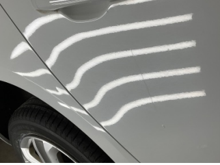
Çamurluk, sağ arka, Çamurluk, sağ arka > Noktasal Ezik