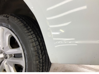
Tampon, arka, Arka tampon > Rötüş