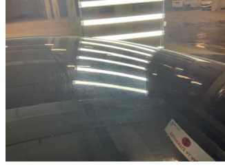
Tavan, Tavan > Noktasal Ezik