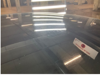
Kaporta, Kaporta > Yakıcı Madde Ile Zarar Görmüş