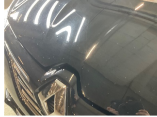
Motor kaputu, Motor kaputu > Rötüş