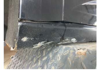
Marşbiyel, sol, Marşbiyel, sol > Çizik