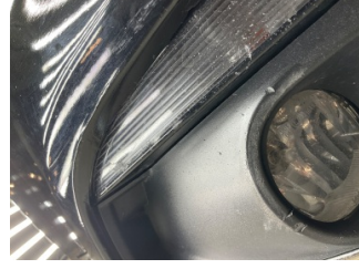
Sis lambaları, Sis farı camı, sağ > Çatlak