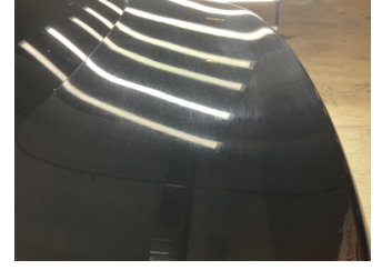
Kaporta, Kaporta > Yakıcı Madde Ile Zarar Görmüş