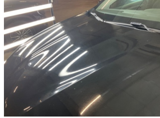
Kaporta, Kaporta > Yakıcı Madde Ile Zarar Görmüş