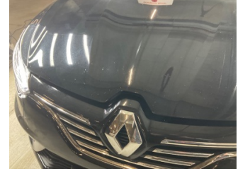
Motor kaputu, Motor kaputu > Taş İzi