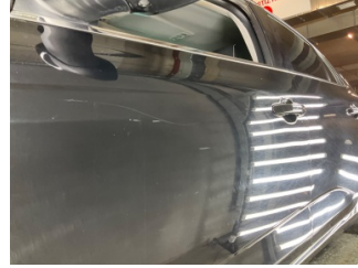
Kapı, sol ön, Kapı, sol ön > Çizik