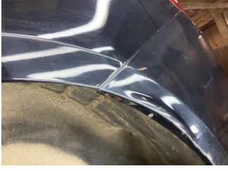
Tampon, arka, Arka tampon > Standart Dışı Onarım

Sayfa: 11/13 Araç Çıkış Tarihi: 18.04.2026 10:11