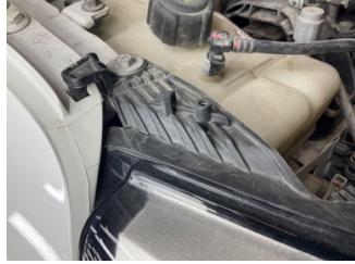
Farlar, Far bağlantı ayağı, sağ > Kırılmış