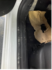
Taban, Paspaslar > Eksik