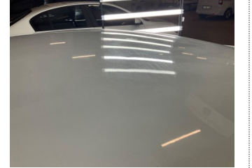
Kaporta, Kaporta > Dolu Hasarı