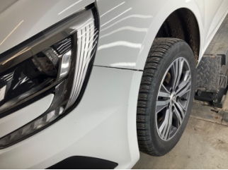
Tampon, ön, Ön tampon > Sabitlemesi Hatalı