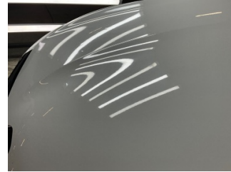
Kaporta, Kaporta > Dolu Hasarı