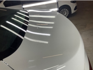
Kaporta, Kaporta > Dolu Hasarı