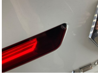
Arka lambalar, Arka lamba camı, sol > Kırılmış