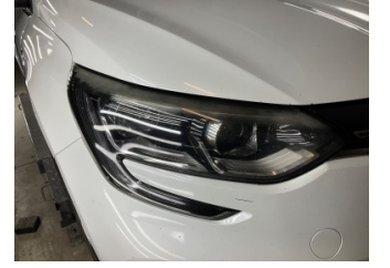
Farlar, Far camı, sağ > Deforme Olmuş