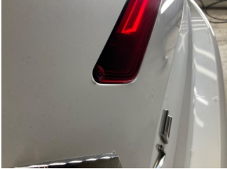
Arka lambalar, Arka lamba camı, sağ > Kırılmış