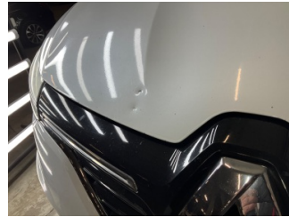
Motor kaputu, Motor kaputu > Vuruk