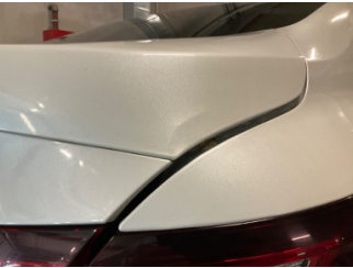
Bagaj kapağı/kapısı, Bagaj kapısı, sağ > Vuruk