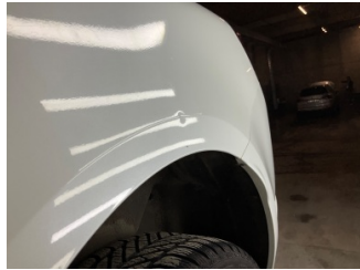
Çamurluk, sol arka, Çamurluk, sol arka > Vuruk