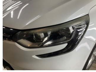
Farlar, Far camı, sol > Deforme Olmuş