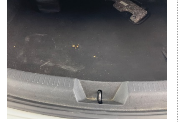
Döşemeler/Kapaklar, Bagaj bölümü döşemesi > Delinmiş