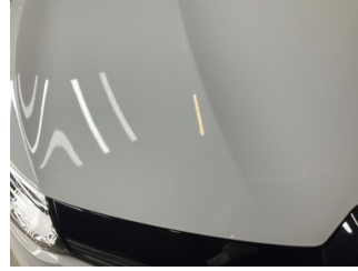
Motor kaputu, Motor kaputu > Taş izi