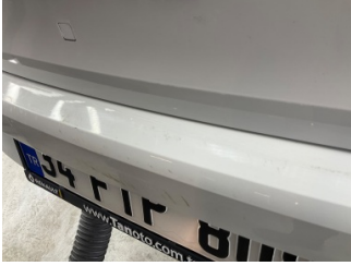
Tampon, arka, Arka tampon > Boyası Atmış