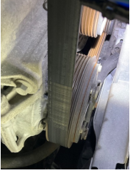
Motorsoğutması, Kayış > Çatlak