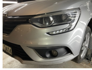
Tampon, ön, Ön tampon > Taş izi