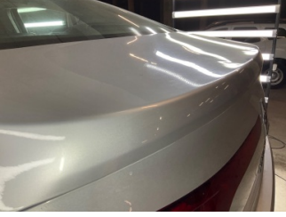
Bagaj kapağı/kapısı, Bagaj kapısı > Dolu Hasarı