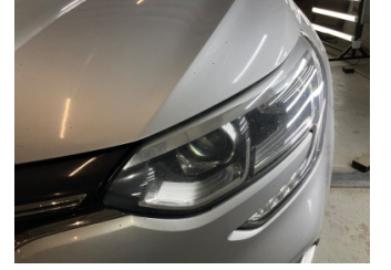
Farlar, Far camı, sol > Taş izi