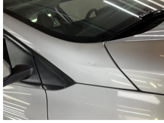
Tavan, Ön cam direği, sağ > Taş izi