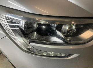
Farlar, Far camı, sağ > Taş izi