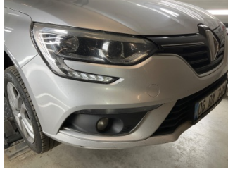
Tampon, ön, Ön tampon > Taş izi