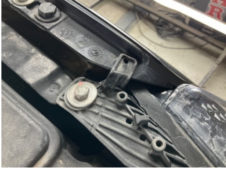
Farlar, Far bağlantı ayağı, sol > Kırılmış