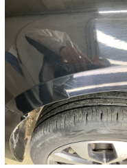
Çamurluk, sol, Çamurluk, sol > Hasarlı