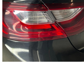
Arka lambalar, Arka lambalar, sol > Hasarlı