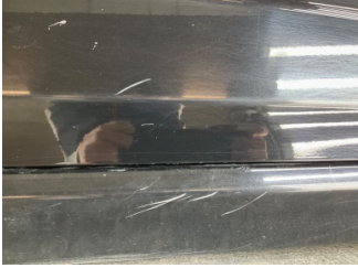
Marşbiyel, sağ, Marşbiyel, sağ > Çizik