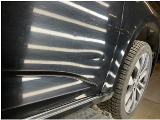
Kapı, sağ ön, Kapı, sağ ön > Ezic