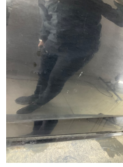
Kapı, sol ön, Kapı, sol ön > Küçük Çizik