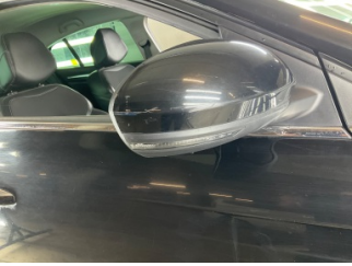
Dikiz aynası, sağ, Dış dikiz aynası kapağı > Çizik