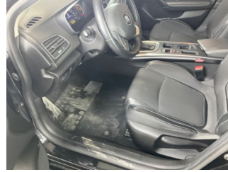
Taban, Paspaslar > Eksik