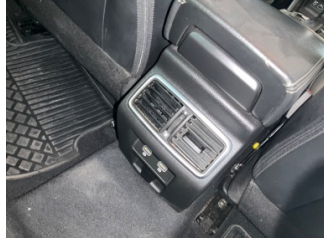
Kalorifer/Klima, Havalandırma ızgarası > Hasarlı