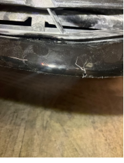
Tampon, ön, Ön tampon > Kırılmış

Sayfa: 11/12 Araç Çıkış Tarihi: 02.04.2026 15:28