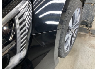
Tampon, ön, Ön tampon > Sabitlemesi Hatalı