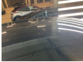
Kaporta, Kaporta > Yakıcı Madde İle Zarar Görmüş