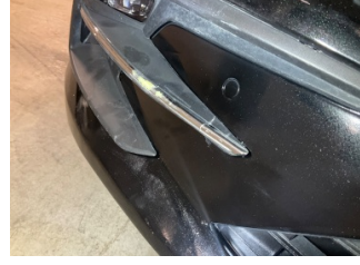
Sis lambaları, Sis Iızgarası Sol > Hasarlı