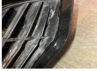
Tampon, ön, Ön tampon ızgarası > Sabitlemesi Hatalı