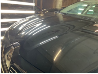
Kaporta, Kaporta > Yakıcı Madde İle Zarar Görmüş