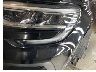
Farlar, Far camı, sol > Islak-Nemli