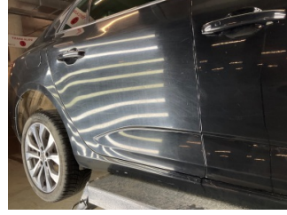
Kaporta, Kaporta > Yüzeysel Çizik