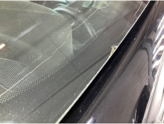
Camlar, Ön cam > Çatlak