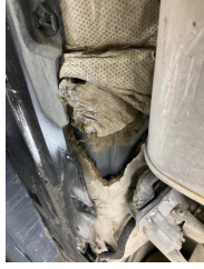
Kaporta, Muhafaza, orta > Hasarlı