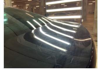
Bagaj kapağı/kapısı, Bagaj kapısı > Noktasal Ezik