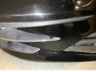
Sis lambaları, Sis Izgarası Sağ > Kırılmış