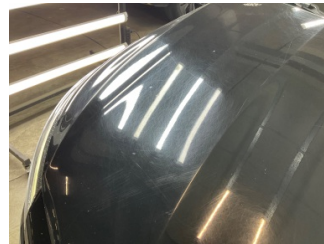
Motor kaputu, Motor kaputu > Yakıcı Madde ile Zarar Görmüş