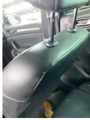
Döşemeler/Kapaklar, Döşemeler/Kapaklar > Hasarlı