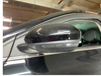
Dikiz aynası, sol, Dış dikiz aynası kapağı > Çizik