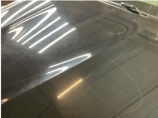
Motor kaputu, Motor kaputu > Çizik