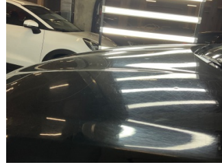
Kaporta, Kaporta > Dolu Hasarı