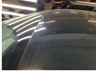
Tavan, Tavan > Yakıcı Madde ile Zarar Görmüş