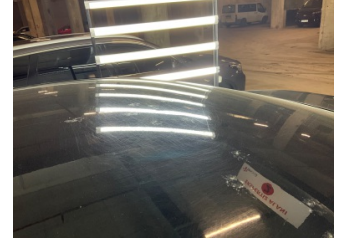
Kaporta, Kaporta > Dolu Hasarı