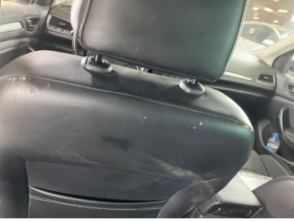
Döşemeler/Kapaklar, Döşemeler/Kapaklar > Hasarlı