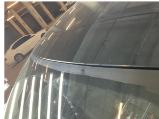
Camlar, Ön cam > Onaysız