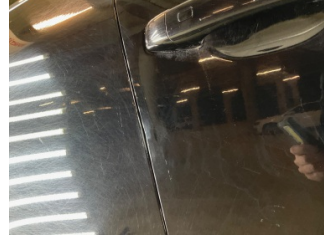
Kapı, sağ ön, Kapı, sağ ön > Küçük Vuruk