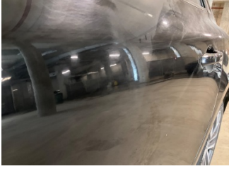
Kapı, sol arka, Kapı, sol arka > Noktasal Ezik

Sayfa: 10/12 Araç Çıkış Tarihi: 09.05.2026 09:57