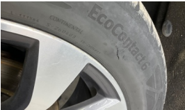
Lastik, sol ön > Hasarlı