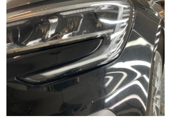
Farlar, Far camı, sol > Islak-Nemli