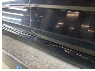
Kapı, sağ ön, Kapı, sağ ön > Küçük Vuruk