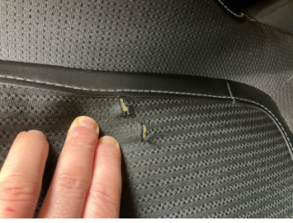
Koltuklar, ön, Koltuk döşemesi, sol ön > Onaysız