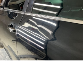
Çamurluk, sol arka, Çamurluk, sol arka > Küçük Vuruk