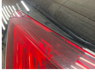
Arka lambalar, Arka lamba camı, sol > Çatlak