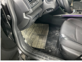
Taban, Paspaslar > Hasarlı