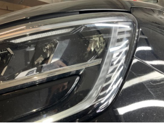
Farlar, Far camı, sol > Çizik