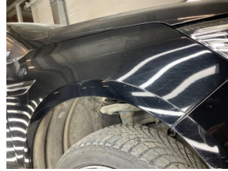
Çamurluk, sağ, Çamurluk, sağ > Çizik