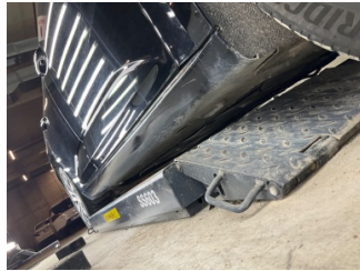
Marşbiyel, sağ, Marşbiyel, sağ > Vuruk