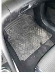
Taban, Paspaslar > Hasarlı