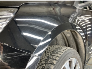
Kapı, sol ön, Kapı, sol ön > Vuruk