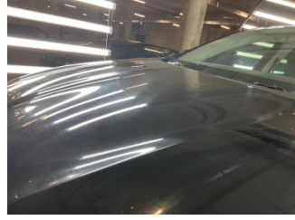
Kaporta, Kaporta > Yakıcı Madde İle Zarar Görmüş