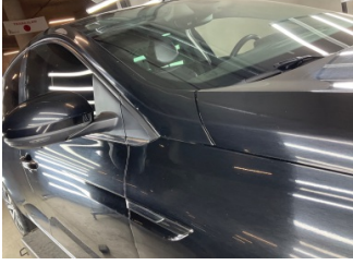
Kaporta, Kaporta > Taş İzi