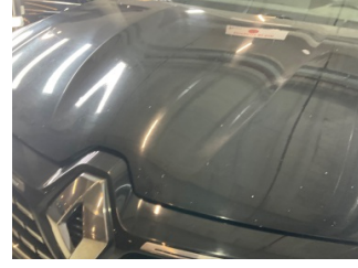
Kaporta, Kaporta > Taş İzi