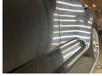
Kapı, sol ön, Kapı, sol ön > Noktasal Ezik