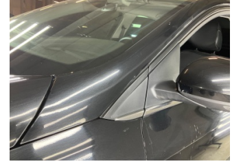
Kaporta, Kaporta > Taş İzi