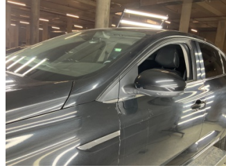
Kaporta, Kaporta > Yüzeysel Çizik