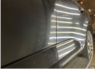
Kapı, sol arka, Kapı, sol arka > Noktasal Ezik

Sayfa: 10/12 Araç Çıkış Tarihi: 05.05.2026 15:39