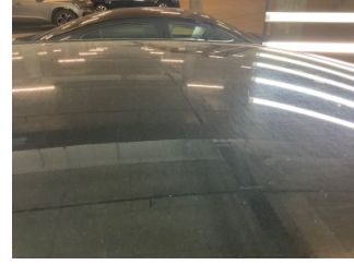
Kaporta, Kaporta > Yakıcı Madde İle Zarar Görmüş