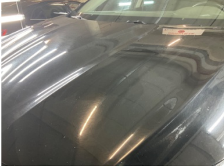
Kaporta, Kaporta > Yüzeysel Çizik