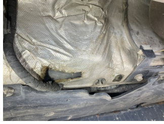
Kaporta, Muhafaza, orta > Hasarlı