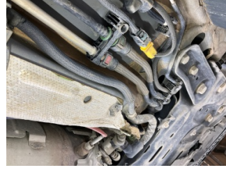
Kaporta, Muhafaza, orta > Hasarlı