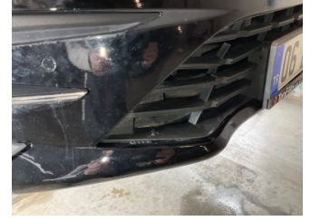
Tampon, ön, Ön tampon ızgarası > Sabitlemesi Hatalı