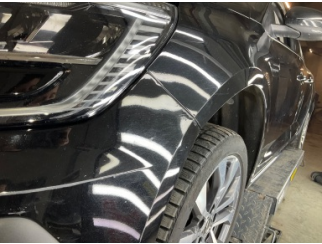
Çamurluk, sol, Çamurluk, sol > Ezik