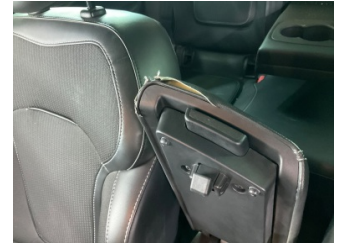
Döşemeler/Kapaklar, Kol dayaması, ön > Dikişleri Açılmış