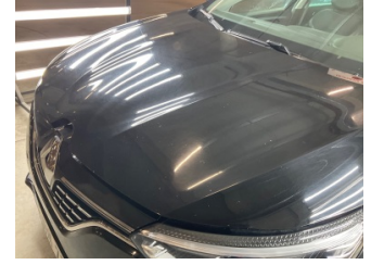
Motor kaputu, Motor kaputu > Taş izi