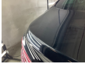
Bagaj kapağı/kapısı, Bagaj kapısı > Küçük Vuruk