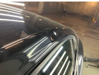
Kaporta, Sol Üst Frangart > Ezik