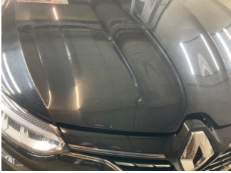
Motor kaputu, Motor kaputu > Taş izi