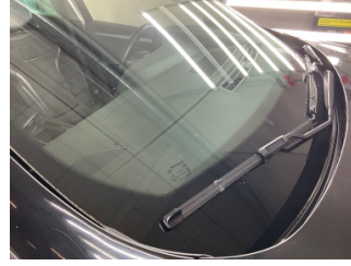
Camlar, Ön cam > Taş izi