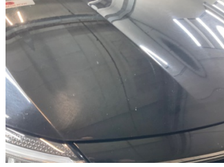
Motor kaputu, Motor kaputu > Taş İzi