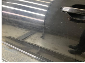
Kapı, sol ön, Kapı, sol ön > Çizik