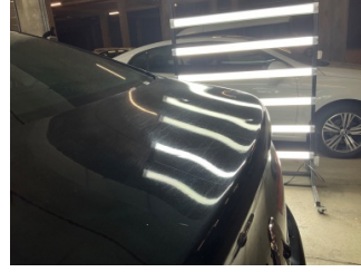
Bagaj kapağı/kapısı, Bagaj kapısı > Noktasal Ezik