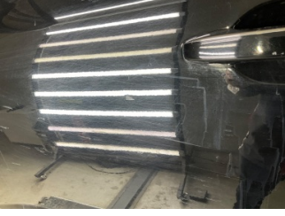
Kapı, sol ön, Kapı, sol ön > Küçük Çizik