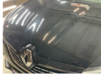
Motor kaputu, Motor kaputu > Taş İzi