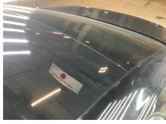
Tavan, Tavan > Noktasal Ezik