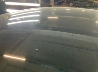
Tavan, Cam tavan > Yakıcı Madde ile Zarar Görmüş