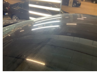
Kaporta, Kaporta > Yakıcı Madde Ile Zarar Görmüş