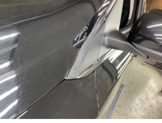
Dikiz aynası, sol, Dış dikiz aynası bağlantısı > Ezik