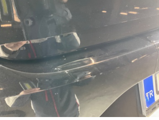
Tampon, arka, Arka tampon > Çatlak