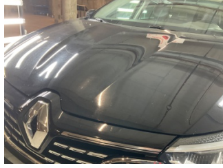
Motor kaputu, Motor kaputu > Yüzeysel Çizik