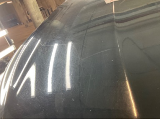
Kaporta, Kaporta > Yakıcı Madde Ile Zarar Görmüş