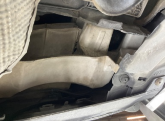
Tampon, arka, Bağlantı ayağı > Hasarlı