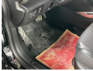
Taban, Paspaslar > Hasarlı