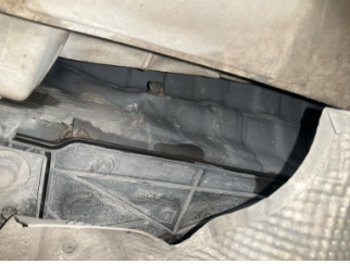
Arka bölüm, Arka sac/panel > Ezik