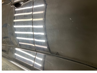
Kapı, sol arka, Kapı, sol arka > Yüzeysel Çizik