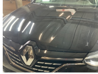
Motor kaputu, Motor kaputu > Taş İzi