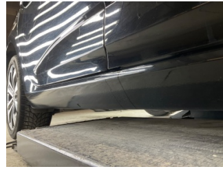
Marşbiyel, sağ, Sabitleme > Küçük Vuruk