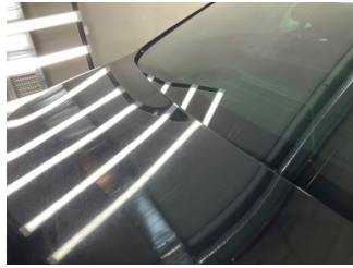
Kaporta, Kaporta > Yakıcı Madde İle Zarar Görmüş