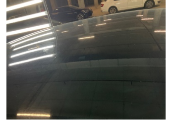
Kaporta, Kaporta > Yakıcı Madde İle Zarar Görmüş