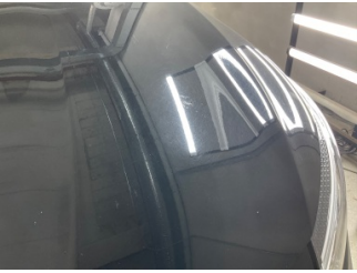
Kaporta, Kaporta > Yakıcı Madde İle Zarar Görmüş