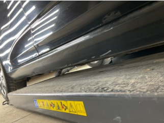
Marşbiyel, sağ, Marşbiyel, sağ > Çizik