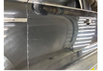
Kapı, sol ön, Kapı, sol ön > Çizik