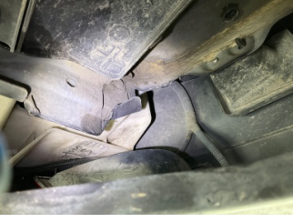
Arka bölüm, Arka sac/panel > Ezik