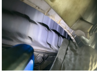
Arka bölüm, Arka sac/panel > Ezik