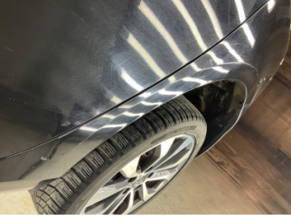
Çamurluk, sol arka, Çamurluk, sol arka > Standart Dışı Onarım