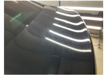
Kaporta, Kaporta > Yakıcı Madde Ile Zarar Görmüş