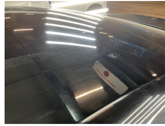
Kaporta, Kaporta > Yakıcı Madde Ile Zarar Görmüş