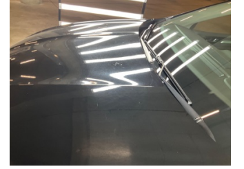
Kaporta, Kaporta > Yakıcı Madde Ile Zarar Görmüş