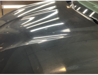
Kaporta, Kaporta > Dolu Hasarı