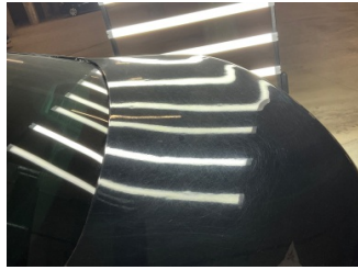
Kaporta, Kaporta > Dolu Hasarı