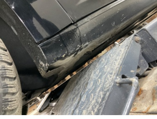
Marşbiyel, sol, Marşbiyel, sol > Küçük Vuruk