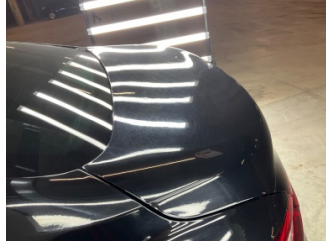
Kaporta, Kaporta > Yakıcı Madde Ile Zarar Görmüş