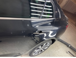
Kaporta, Kaporta > Yakıcı Madde Ile Zarar Görmüş