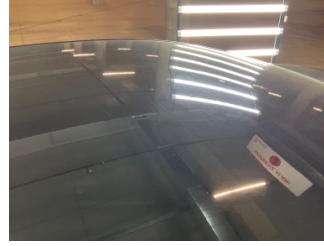
Kaporta, Kaporta > Yakıcı Madde Ile Zarar Görmüş