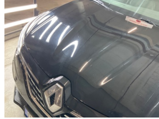
Motor kaputu, Motor kaputu > Taş İzi