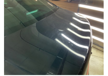
Kaporta, Kaporta > Yakıcı Madde Ile Zarar Görmüş