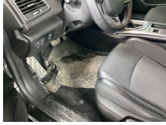
Taban, Paspaslar > Hasarlı