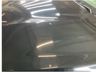
Kaporta, Kaporta > Yakıcı Madde Ile Zarar Görmüş