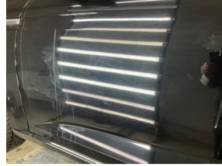
Kapı, sol ön, Kapı, sol ön > Çizik