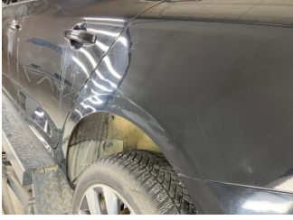
Çamurluk, sol arka, Çamurluk, sol arka > Hasarlı