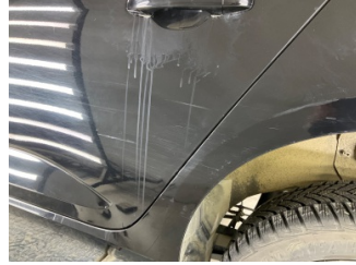
Kapı, sol arka, Kapı, sol arka > Çizik