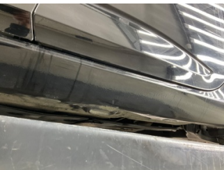
Marşbiyel, sol, Marşbiyel, sol > Ezik