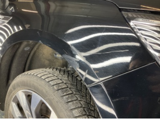
Çamurluk, sağ, Çamurluk, sağ > Çizik