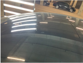
Kaporta, Kaporta > Yakıcı Madde Ile Zarar Görmüş