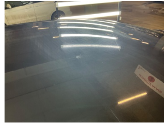
Tavan, Tavan > Yakıcı Madde İle Zarar Görmüş