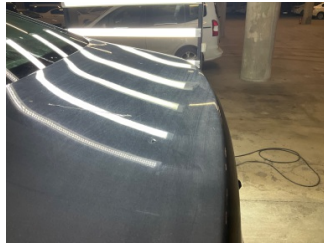
Bagaj kapağı/kapısı, Bagaj kapısı > Noktasal Ezik