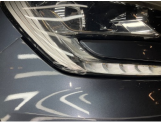
Farlar, Far camı, sağ > Çatlak