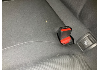
Döşemeler/Kapaklar, Döşemeler/Kapaklar > Yakıcı Madde Ile Zarar Görmüş