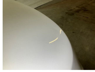
Bagaj kapağı/kapısı, Bagaj kapısı > Noktasal Ezik