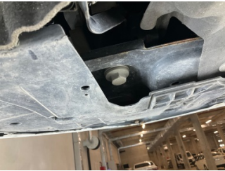
Tampon, ön, Tampon koruyucu orta > Sabitlemesi Hatalı