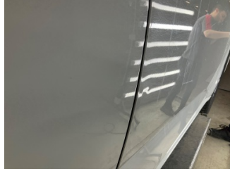
Kapı, sağ ön, Kapı, sağ > Ezik