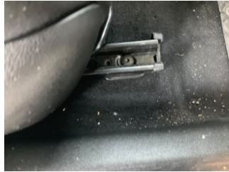
Döşemeler/Kapaklar, Döşemeler/Kapaklar > Yakıcı Madde Ile Zarar Görmüş