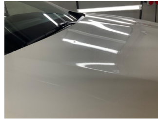
Motor kaputu, Motor kaputu > Noktasal Ezik