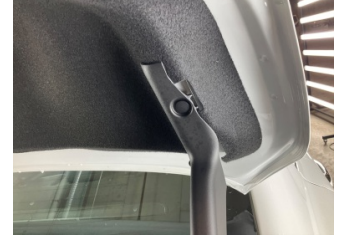
Döşemeler/Kapaklar, Bagaj bölümü döşemesi > Hasarlı