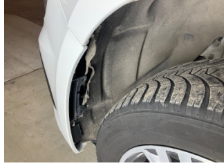
Çamurluk, sol, Davlumbaz > Hasarlı