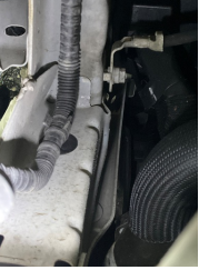
Kaporta, Ön Panel > Ezik