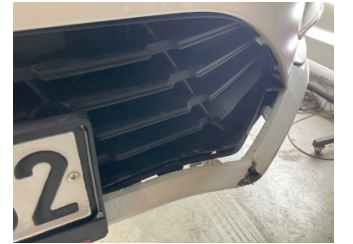
Tampon, ön, Ön tampon ızgarası > Hasarlı