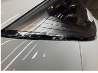
Farlar, Far camı, sağ > Çatlak

Sayfa: 10/12 Araç Çıkış Tarihi: 05.06.2026 13:53