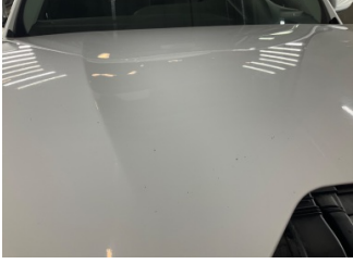
Motor kaputu, Motor kaputu > Taş lzi