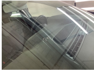
Camlar, Ön cam > Çatlak