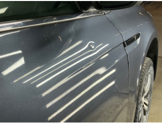
Kapı, sağ ön, Kapı, sağ ön > Ezic