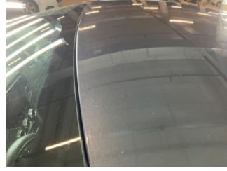
Tavan, Tavan > Taş Izi