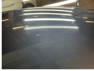
Tavan, Tavan > Yakıcı Madde ile Zarar Görmüş