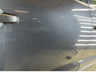
Kapı, sağ arka, Kapı, sağ arka > Noktasal Ezik