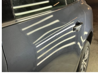
Kapı, sol arka, Kapı, sol arka > Noktasal Ezik