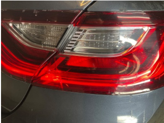
Arka lambalar, Arka lamba camı, sağ > Hasarlı