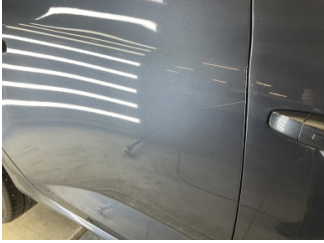
Kapı, sağ arka, Kapı, sağ arka > Küçük Çizik