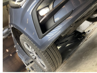
Tampon, ön, Ön tampon > Küçük Çizik