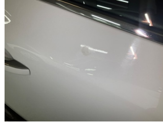
Kapı, sağ arka, Kapı, sağ arka > Yakıcı Madde Ile Zarar Görmüş