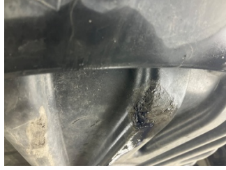
Arka bölüm, Bagaj havuzu > Hasarlı