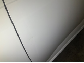
Kapı, sol ön, Kapı, sol ön > Çizik