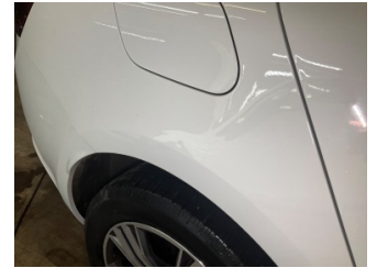
Çamurluk, sağ arka, Çamurluk, sağ arka > Vuruk