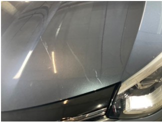
Motor kaputu, Motor kaputu > Yüzeysel Çizik