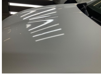
Motor kaputu, Motor kaputu > Noktasal Ezik