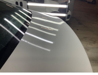
Bagaj kapağı/kapısı, Bagaj kapısı > Noktasal Ezik