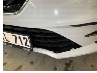
Tampon, ön, Ön tampon ızgarası > Sabitlemesi Hatalı