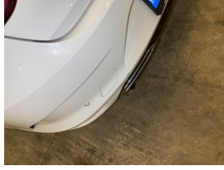
Tampon, arka, Arka tampon > Küçük Çizik