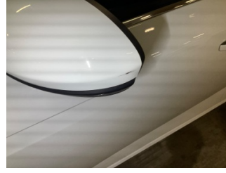
Dikiz aynası, sol, Dış dikiz aynası kapağı > Küçük Çizik